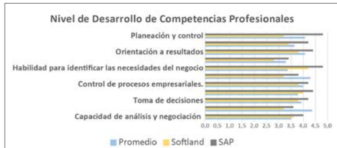
Figura 2 Nivel de desarrollo de competencias profesionales.

Nota: Se presenta la valoración que la muestra considerada en el estudio entrega a diferentes competencias profesionales desarrolladas con apoyo del ERP. La respuesta considera la valoración promedio de la competencia, y la valoración comparada e el desarrollo de la misma por parte de los 2 principales ERP utilizados por la muestra.