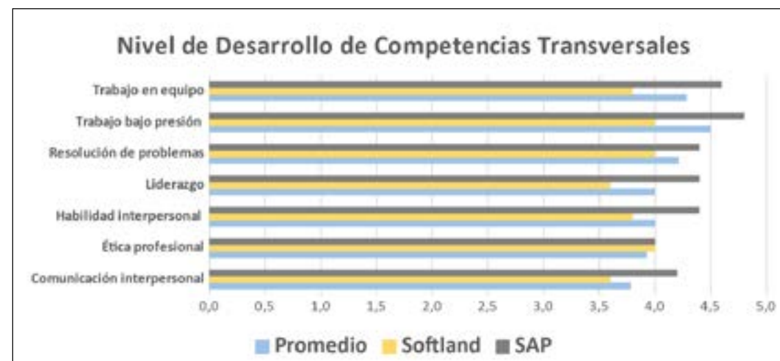
Figura 3 Nivel de desarrollo de competencias transversales.

Nota: Se presenta la valoración que la muestra considerada en el estudio entrega a diferentes competencias transversales desarrolladas con apoyo del ERP. La respuesta considera la valoración promedio de la competencia transversal, y la valoración comparada en el desarrollo de la misma por parte de los 2 principales ERP utilizados por la muestra.